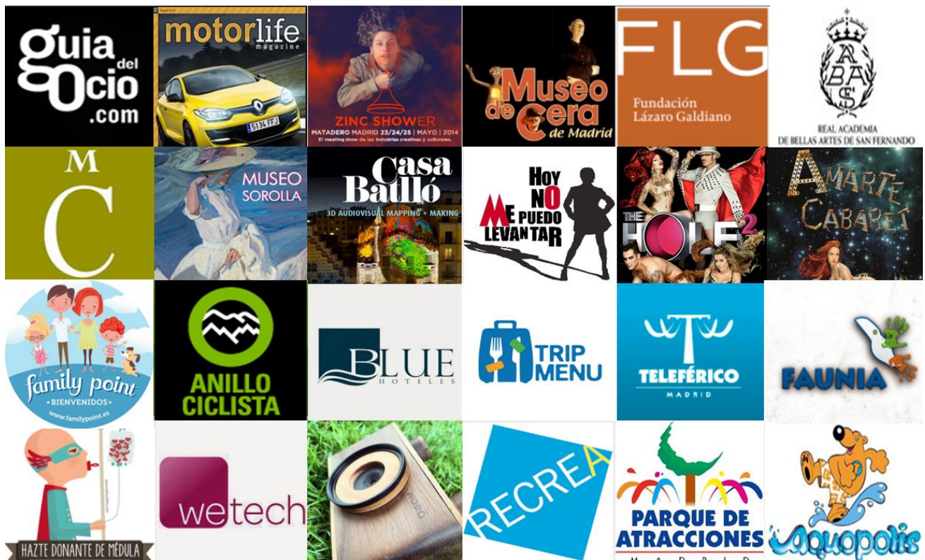
Algunas marcas presentes en beQbe.com

Por otra parte, el usuario puede gestionar la privacidad de sus Qubes, de forma que sean privados, restringidos o enteramente abiertos.