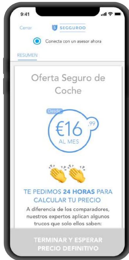
Cálculo de seguro de coche