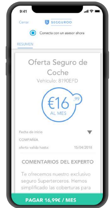
Contratación de seguro de coche