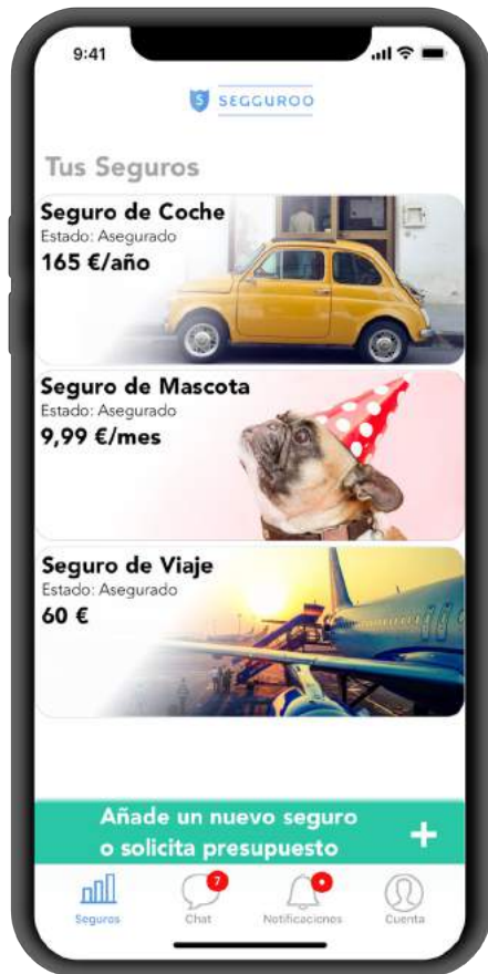
Escritorio de Segguoro