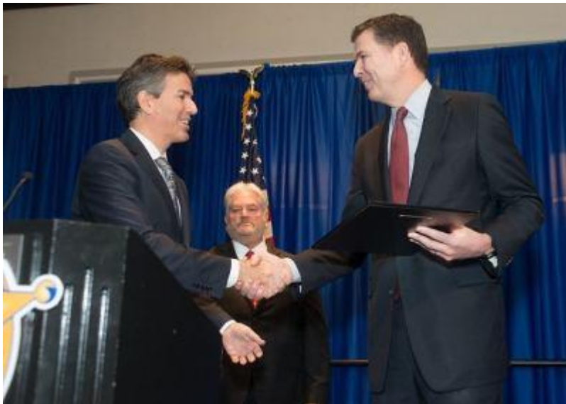
Ex- Director del FBI, James Comey