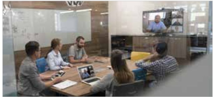
Una videoconferencia segura TIXEO desde una sala de reuniones