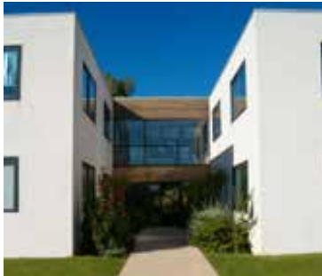
Sede de Tixeo en Montpellier, Francia