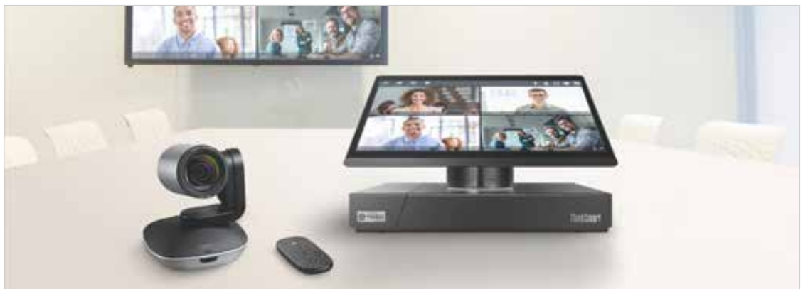
El kit de videoconferencia VideoTouch Compact