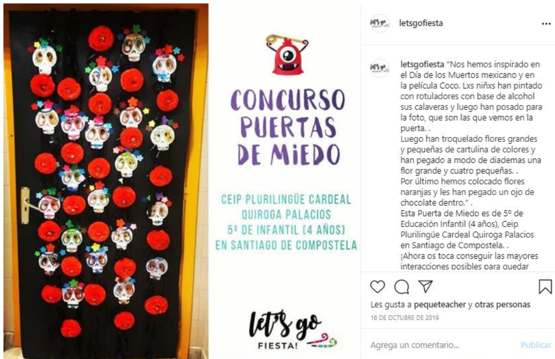
Puerta de Miedo ganadora 2019 en categoría infantil

“¡Fantásticos y merecedores finalistas! ¡Enhorabuena a todos! ¡¡¡Pero mi corazoncito va con la puerta de los chicos del Quiroga Palacios!!! ¿Sabéis la ilusión que les hizo formar parte activa del diseño? ¿Que cada una de sus caritas estuviese presente? Y que luego pudiesen mostrarnos donde estaban tanto ellos como sus amigos... ¡¡Diseño 10!!