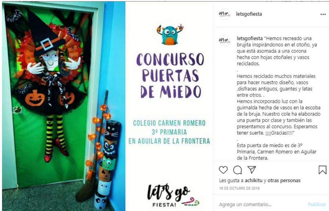
Puerta de Miedo ganadora en 2019 en su categoría primaria-secundaria

El sector de la venta de disfraces, junto a muchos otros minoristas, se encuentra enormemente afectado por las medidas de restricción y las limitaciones de las reuniones sociales.