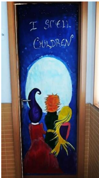
Puerta de Miedo 2019 de 2º ESO del I.E.S José María Infantes