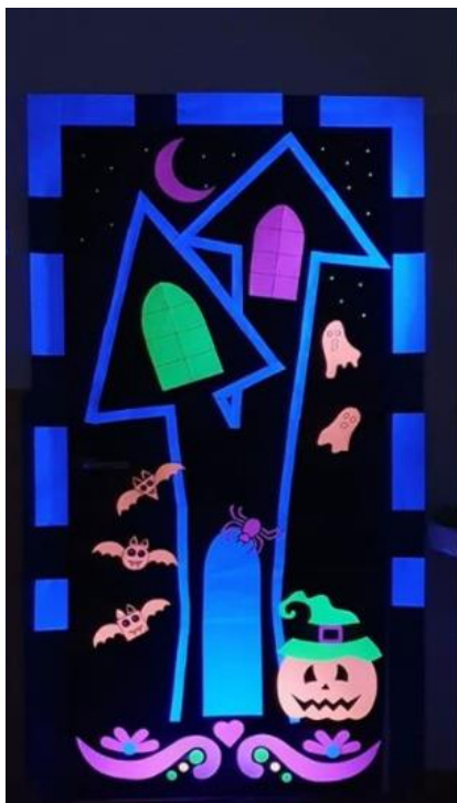
Puerta de Miedo de Origami Centro de Educación Infantil Bilingüe en Murcia