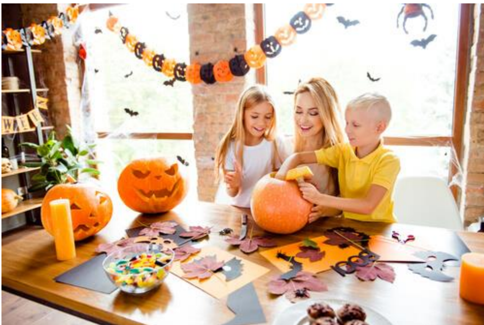
Puertas de Miedo 2020 abre la participación a las familias