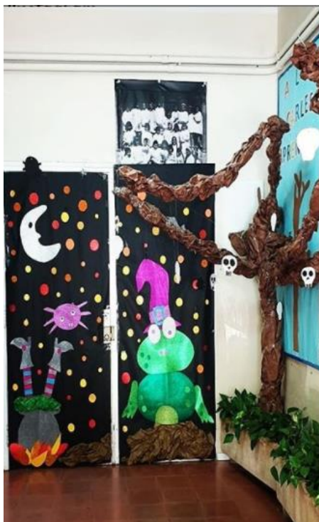
Puerta de Miedo de Aula 2 de Educación Especial ACEESCA en Vigo